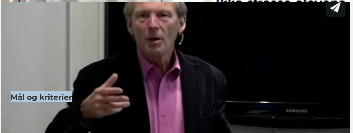
Mål og kriterier