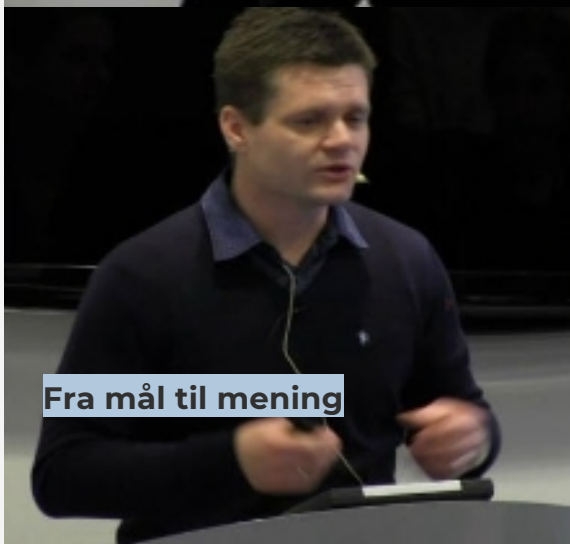
Fra mål til mening